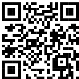
Estatuto de la UNRC

La UNRC es una institución pública de educación superior que se rige por un conjunto de normativas esenciales para el funcionamiento de la comunidad universitaria. Estas normativas establecen los principios, derechos, deberes y procedimientos que orientan la vida académica y administrativa dentro de la universidad. Entre los documentos fundamentales que regulan la estructura y organización de la UNRC, destacan el Estatuto de la UNRC y el Régimen de Estudiantes y Enseñanza de Pregrado y Grado (Resolución 120/17). Estos textos constituyen las bases que guían a los estudiantes, docentes y autoridades, y son esenciales para una integración efectiva y una experiencia universitaria organizada.