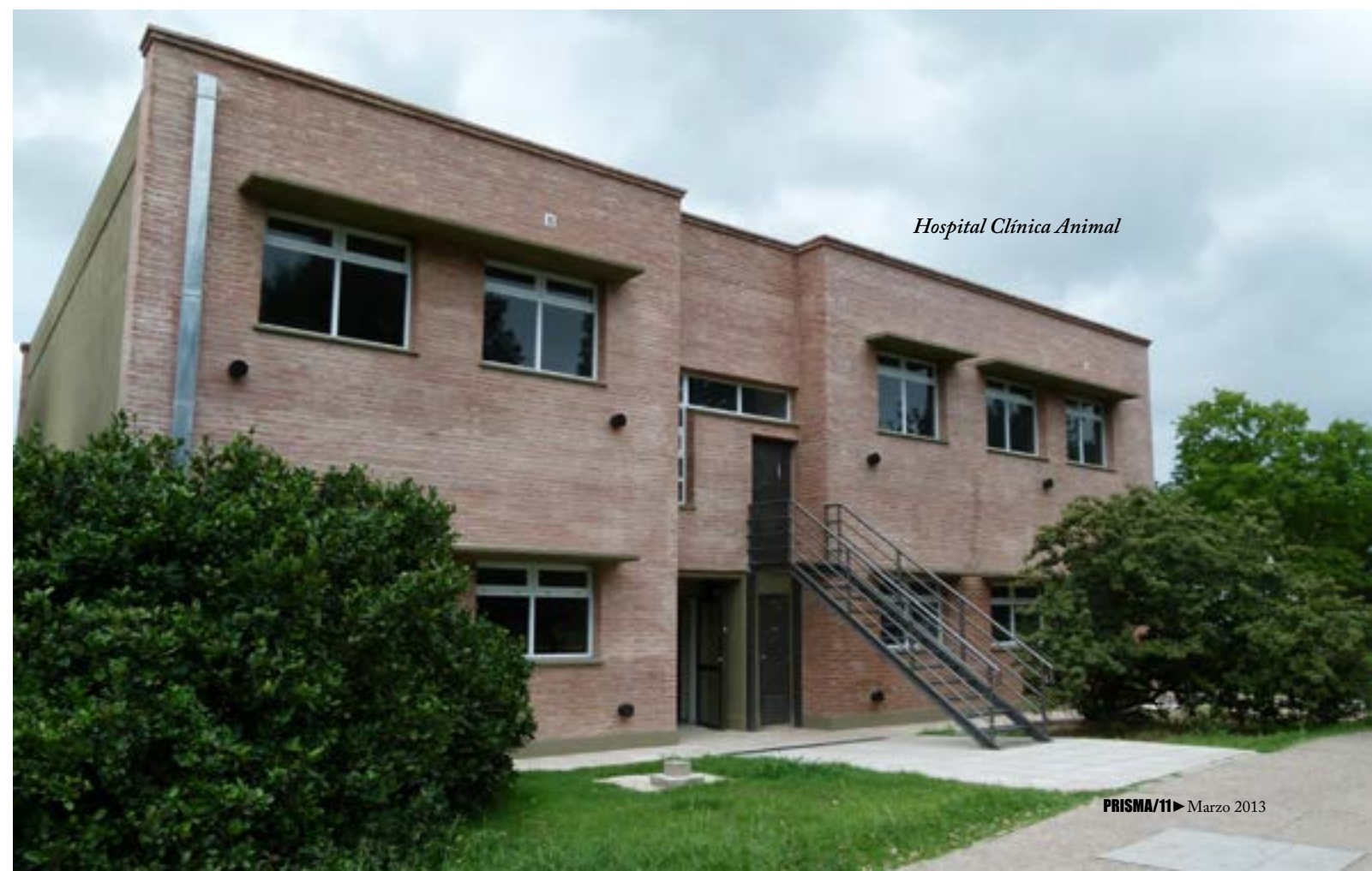
Hospital Clínica Animal